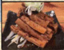
おつまみ 辛メンマ 400