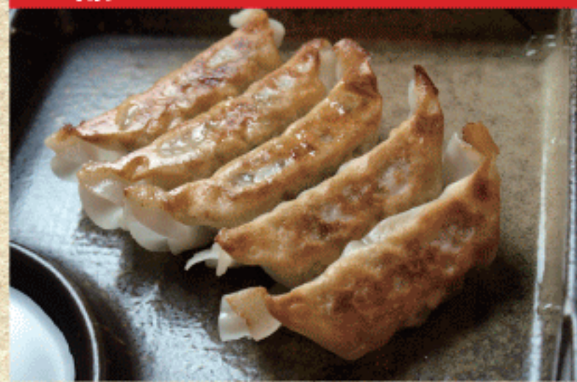
オススメ!! 黒豚餃子(5個) 480