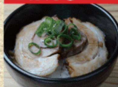
ミニチャーシュー丼 380