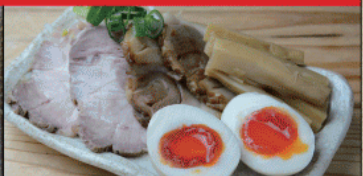
おつまみ三種盛り 650