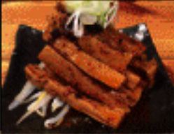
おつまみ 辛メンマ 400