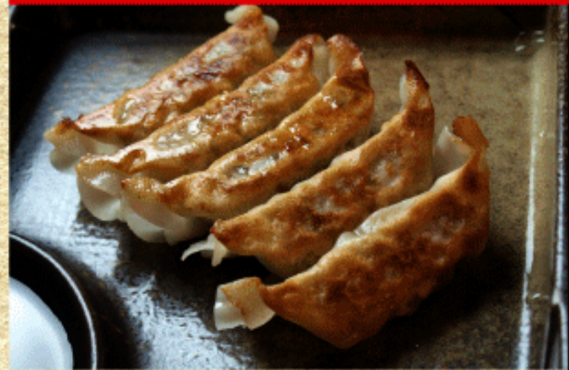
オススメ!! 黒豚餃子(5個) 500