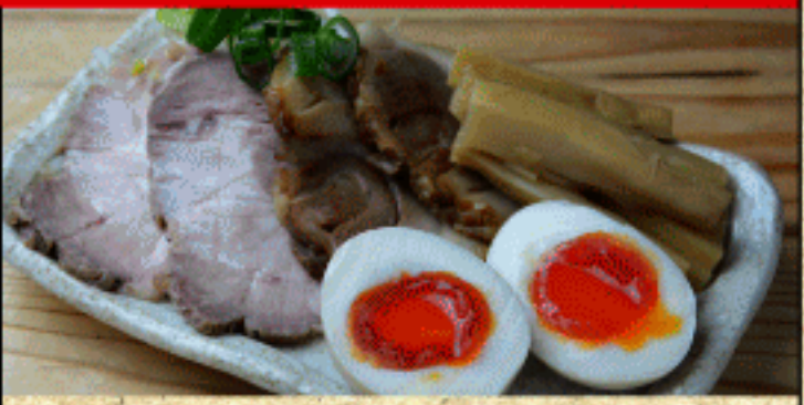
おつまみ三種盛り 650