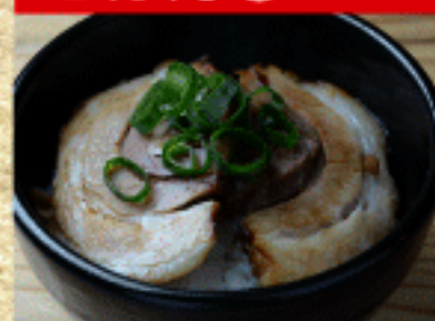
ミニチャーシュー丼 480